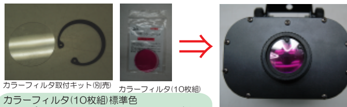
カラーフィルタ取付キット(別売) カラーフィルタ(10枚組)

カラーフィルタ(10枚組) 標準色 U16(ピンク)/U22(レッド)/U31(オレンジ)/ U41(イエロー)/U59(グリーン)/U78(ブルー)/ U72(ダークブルー)/U84(パープル)/ UA-3(CTアンバー)/UB-3(CTブルー)