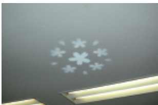
明るい環境でもハッキリと