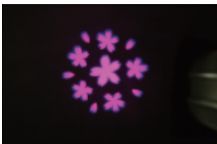
カラーフィルタを取り付けて