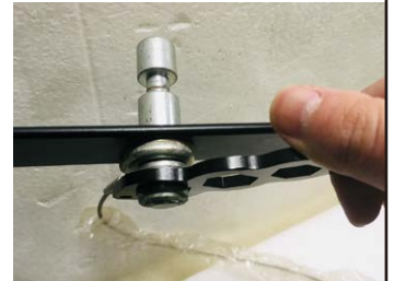
ダボの六角ボルト