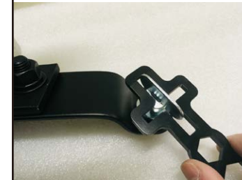
ムービングのオメガクランプ