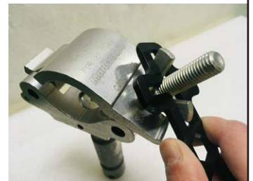
クランプの蝶ナット