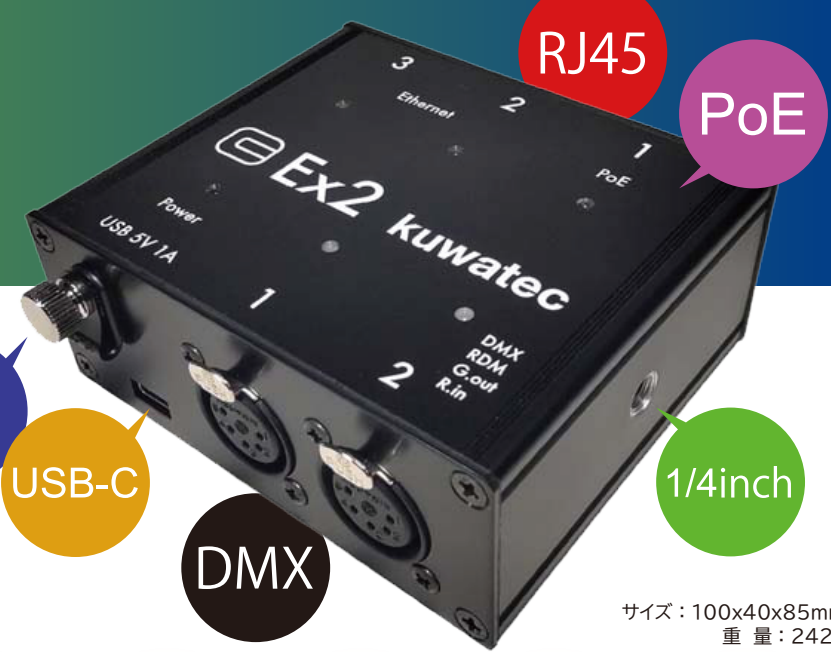
サイズ: 100x40x85mm 重量: 242g