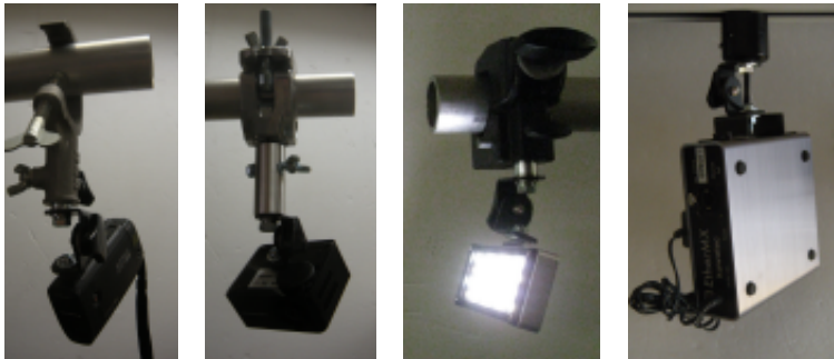
“16/17mmφ兼用ダボ+1/4インチネジセット”と舞台照明用ハンガーで、デジカメを吊る。 “17mmφダボ受+1/4インチネジセット”とみダボ付きクランプで、モバイルプロジェクトを吊る。 “16/17mmφ兼用ダボ+1/4インチネジセット”とスーパークランプで、撮影用LEDを吊る。 “ライティングレールプラグ+1/4インチネジセット”で、各種変換ボックスや安定器を吊る。