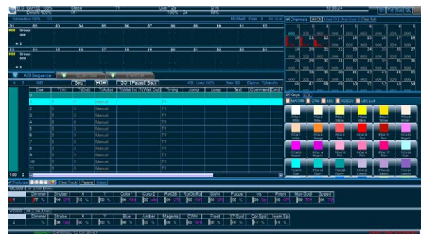
【モニター画面】 ※レイアウトは変更可能