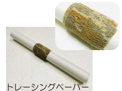
トレーシングペーパー