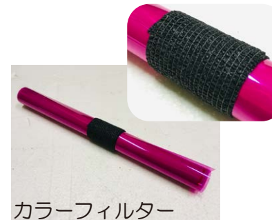
カラーフィルター