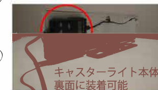
キャスターライト本体裏面に装着可能