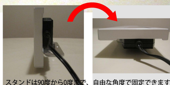
スタンドは90度から0度まで、自由な角度で固定できます