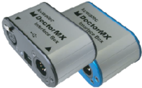
筐体パネル色: 黒 青